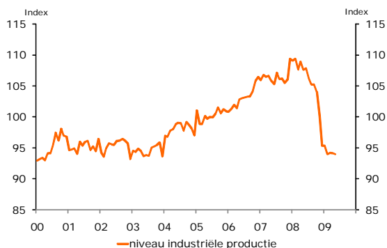
Figuur 3: Terugval productieniveau

Het is overigens goed dat de regeling niet langer duurt. Een langere duur van de deeltijd-WW zou namelijk weer andere bezwaren met zich meebrengen. Werkgevers kunnen erdoor in verleiding komen om moeilijke maar noodzakelijke beslissingen over ontslag van personeel uit te stellen. Als de productie op een structureel lager niveau is uitgekomen en het jaren zal duren voordat het oude niveau weer bereikt is, dan betekent dit dat bij gelijkblijvend personeelsbestand de productiviteit per werknemer omlaag gaat en de kosten per eenheid product daarmee omhoog. Ten opzichte van bedrijven in binnen- en buitenland die wel tijdig saneren betekent dit een achteruitgang van de concurrentiepositie. Het risico bestaat dat de regeling ongezonde bedrijven in stand houdt of gezonde bedrijven minder concurrerend maakt. Als het bedrijf uiteindelijk toch failliet gaat dan is het per saldo weggegooid geld.